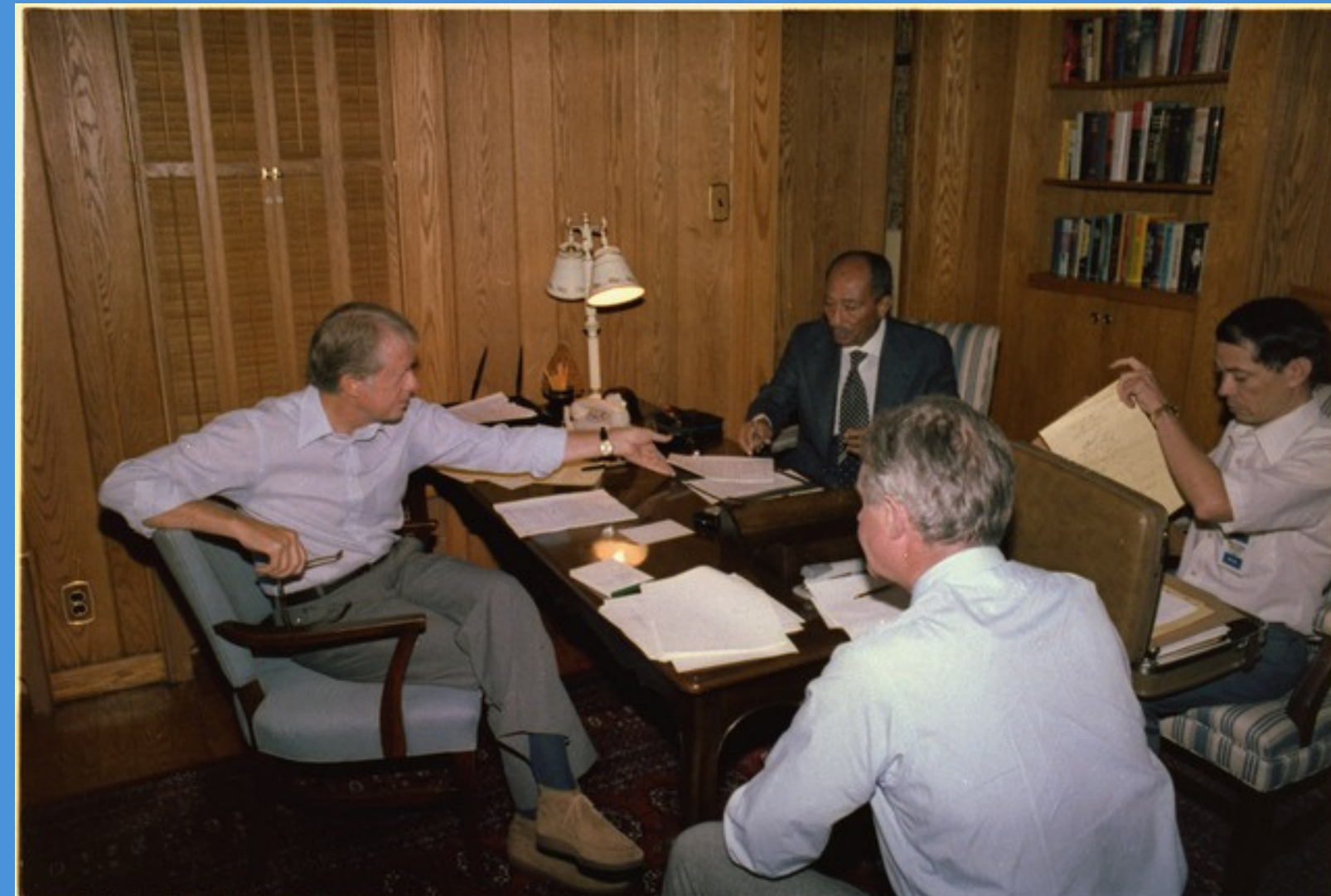
Photo : Jimmy Carter, Anwar Sadat, Boutros Boutros-Ghali et Cyrus Vance à Camp David