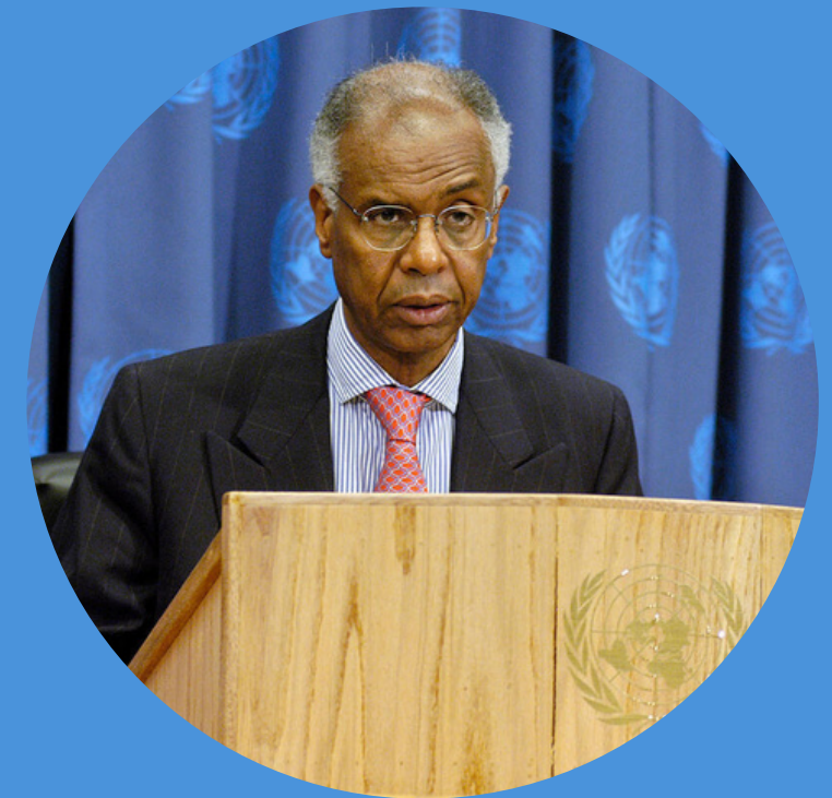
Ahmedou Ould Abdallah

Ambassadeur, représentante de l'OIF à New-York